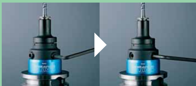
二面拘束によるコレット装着