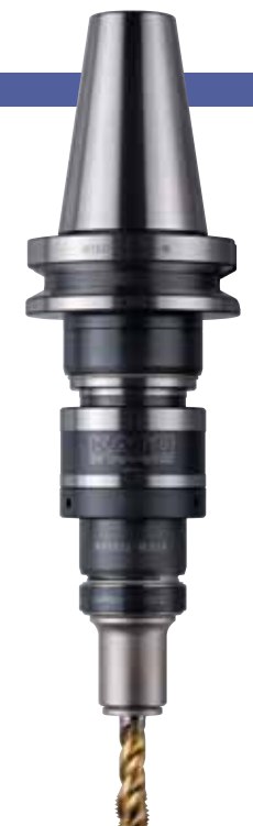
BT50-RA1022-VI + TC1022