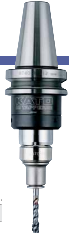
BT40-RA412-M + TC412-MO

※ ☆ の型は受注生産のため納品までに時間がかかる場合があります。ご了承下さい。