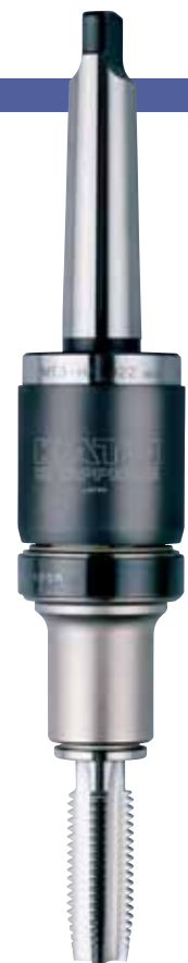
MT3-HA1022 + TC1022

※MT5以上のシャンクにはオークマ(株)、(株)大矢製作所、小川鉄工(株)、岡田メカニカ(株)用向けに4種類のコッタ穴を用意しております。(P65参照)