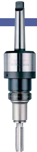
MT3-RA1022 + TC1022